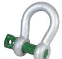
SC Type Harpsluiting