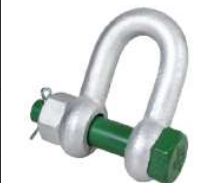
BN Type D-sluiting