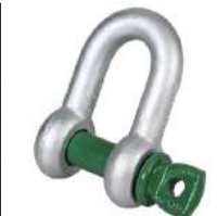
SC Type D-sluiting