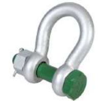
BN Type Harpsluiting