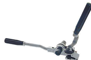
ABB Ty-Met Kabelbundelbanden