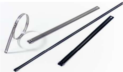
ABB Ty-Met Installatiegereedschap