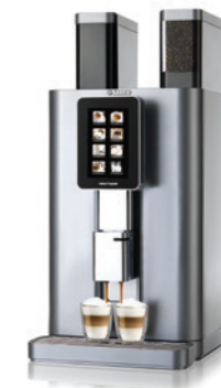
Nextage Master Horeca