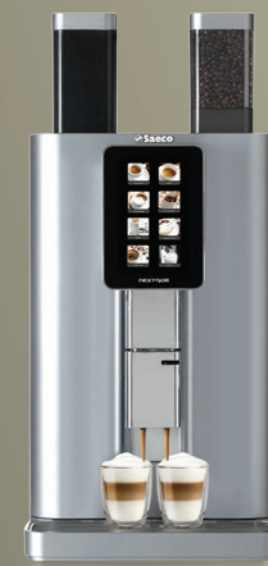
Nextage Master Horeca

Sélection aisée des boissons et programmation de la machine via un écran tactile