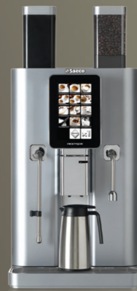
Nextage Master Standard

Sélection aisée des boissons et programmation de la machine via un écran tactile