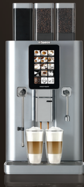
Nextage Master Top