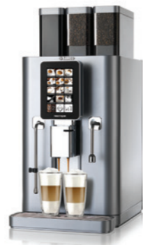
Nextage Master Top