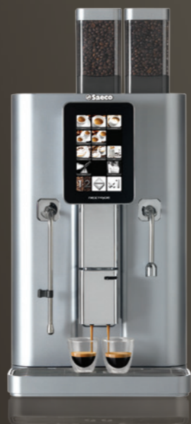
Nextage Master Duo

Gemakkelijke drankselectie en programmering van het apparaat via aanraakscherm