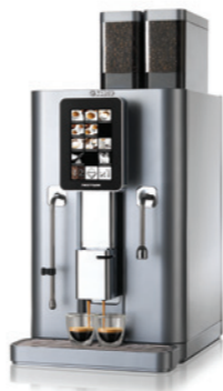
Nextage Master Duo