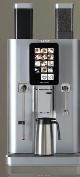
Nextage Master Standard

Gemakkelijke drankselectie en programmering van het apparaat via aanraakscherm