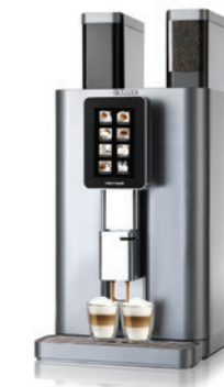
Nextage Master Horeca