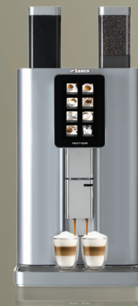
Nextage Master Horeca

Gemakkelijke drankselectie en programmering van het apparaat via aanraakscherm