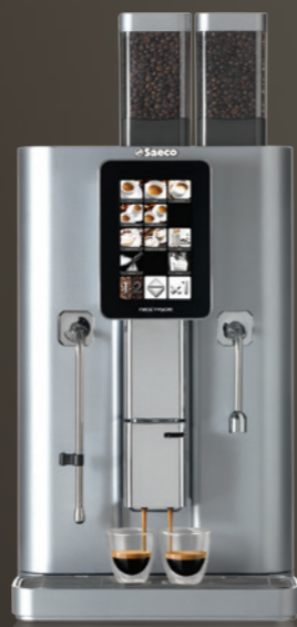
Nextage Master Duo

Sélection aisée des boissons et programmation de la machine via un écran tactile