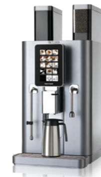
Nextage Master Standard