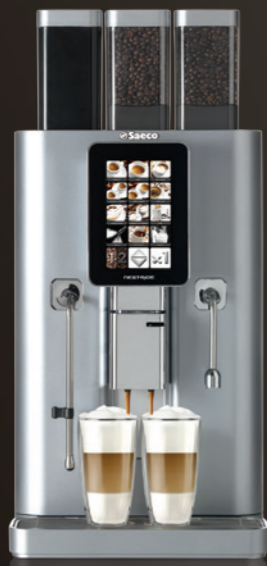
Nextage Master Top