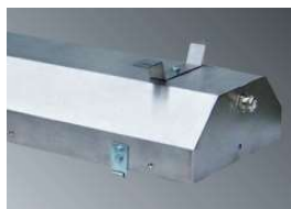
PITBUL-LED Optioneel roestvaststalen behuizing leverbaar AISI 304 & AISI 316